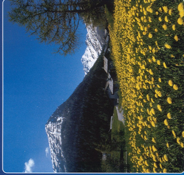
Realizzazione e stampa: Tipografia MARCOZ - Morgex

Comune di Morgex Chrono Test Morgex → Colle San Carlo